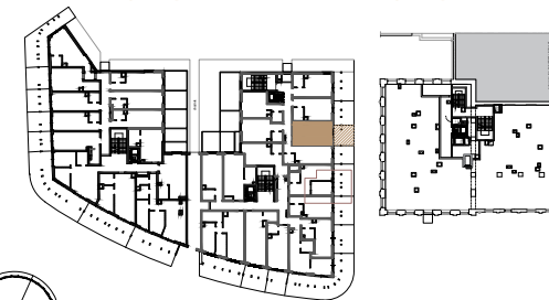
BUDYNEK NR 1