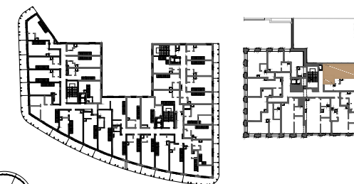
BUDYNEK NR 1