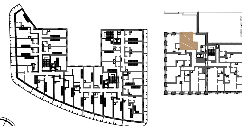
BUDYNEK NR 1