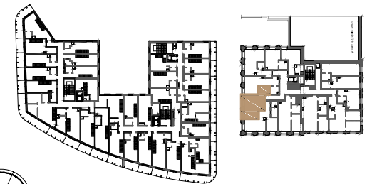
BUDYNEK NR 1