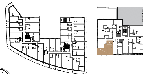
BUDYNEK NR 1