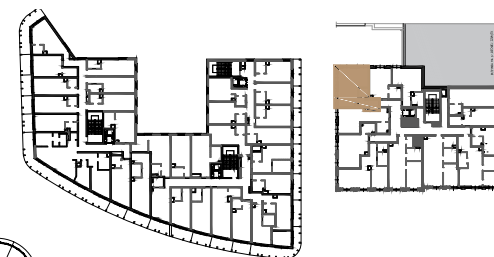
BUDYNEK NR 1