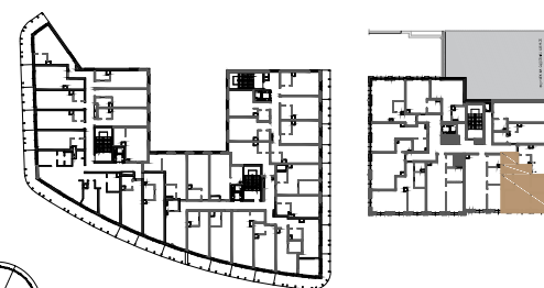
BUDYNEK NR 1