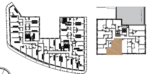
BUDYNEK NR 1