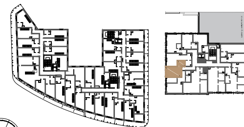
BUDYNEK NR 1