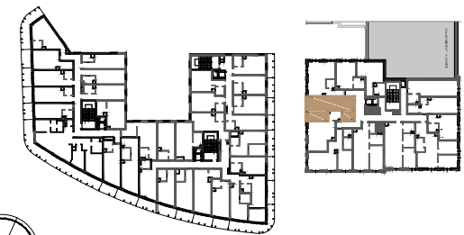
BUDYNEK NR 1