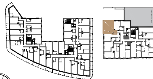
BUDYNEK NR 1