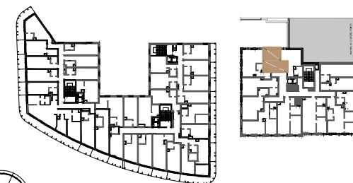
BUDYNEK NR 1